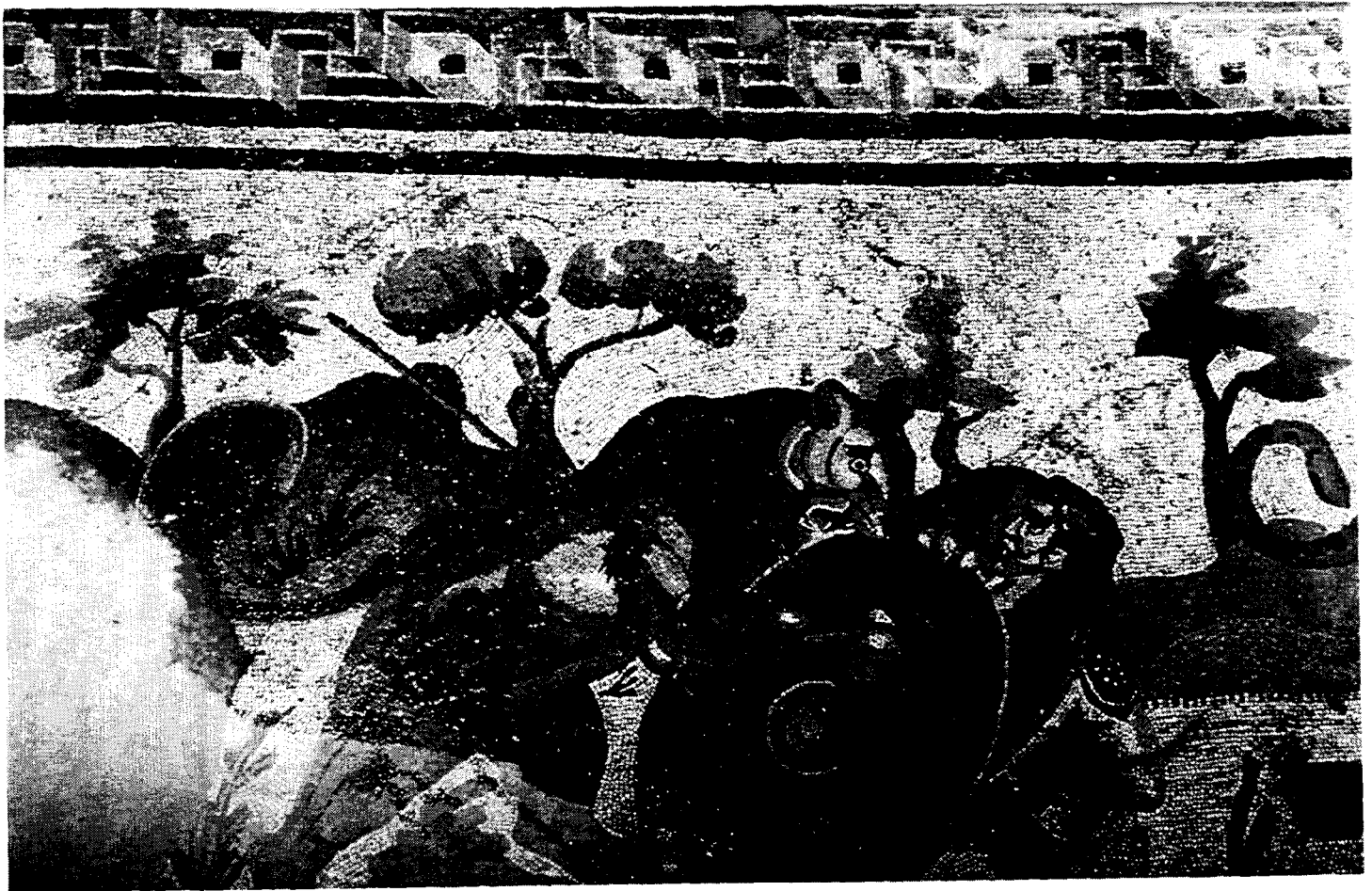
Villa Romana del Casale : Détail de la mosaïque de la Grande Chasse / Detail of Great Hunt Mosaic