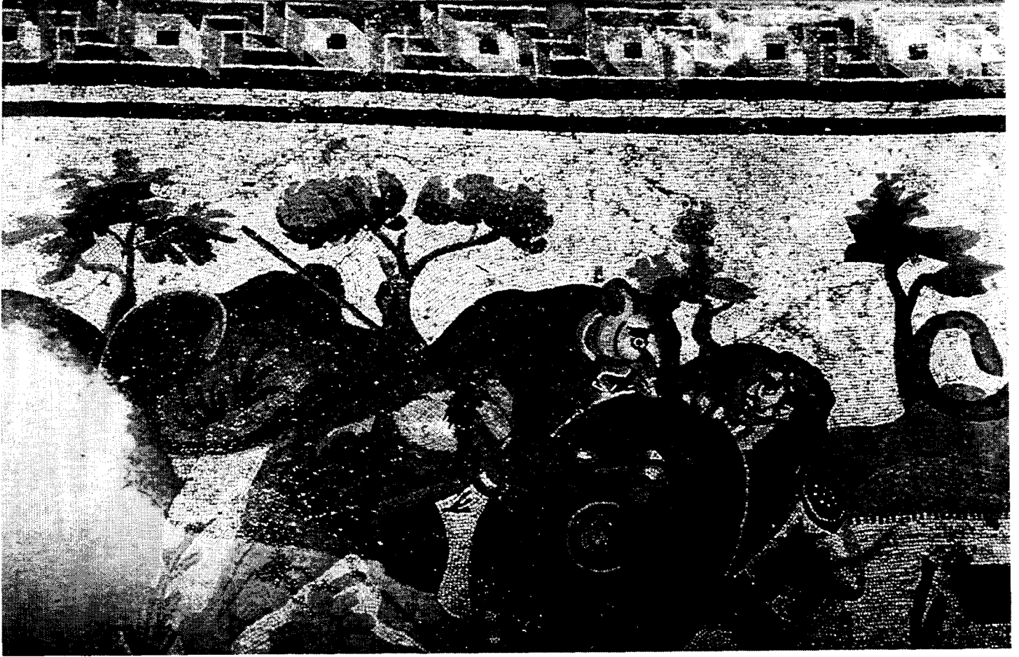
Villa Romana del Casale : Détail de la mosaïque de la Grande Chasse / Detail of Great Hunt Mosaic